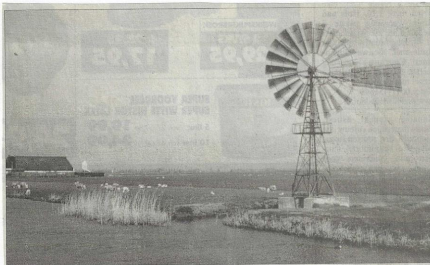
Opname van de in het laatst van de 20ste eeuw afgebroken Amerikaanse windmolen aan de Trekweg onder Gerkesklooster. Op de achtergrond is de boerderij van Bijlsma nog te zien.