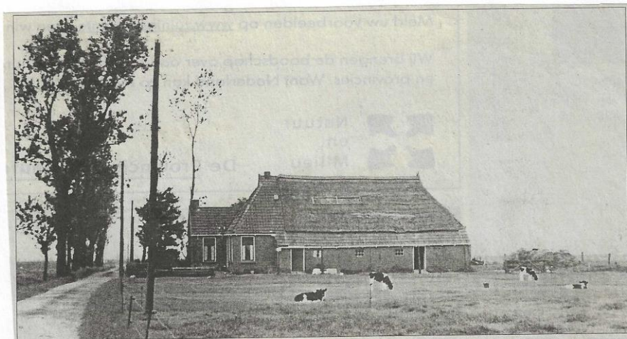
Boerderij aan de Spiensma's Reed te Gerkesklooster, afgebroken in 1967.