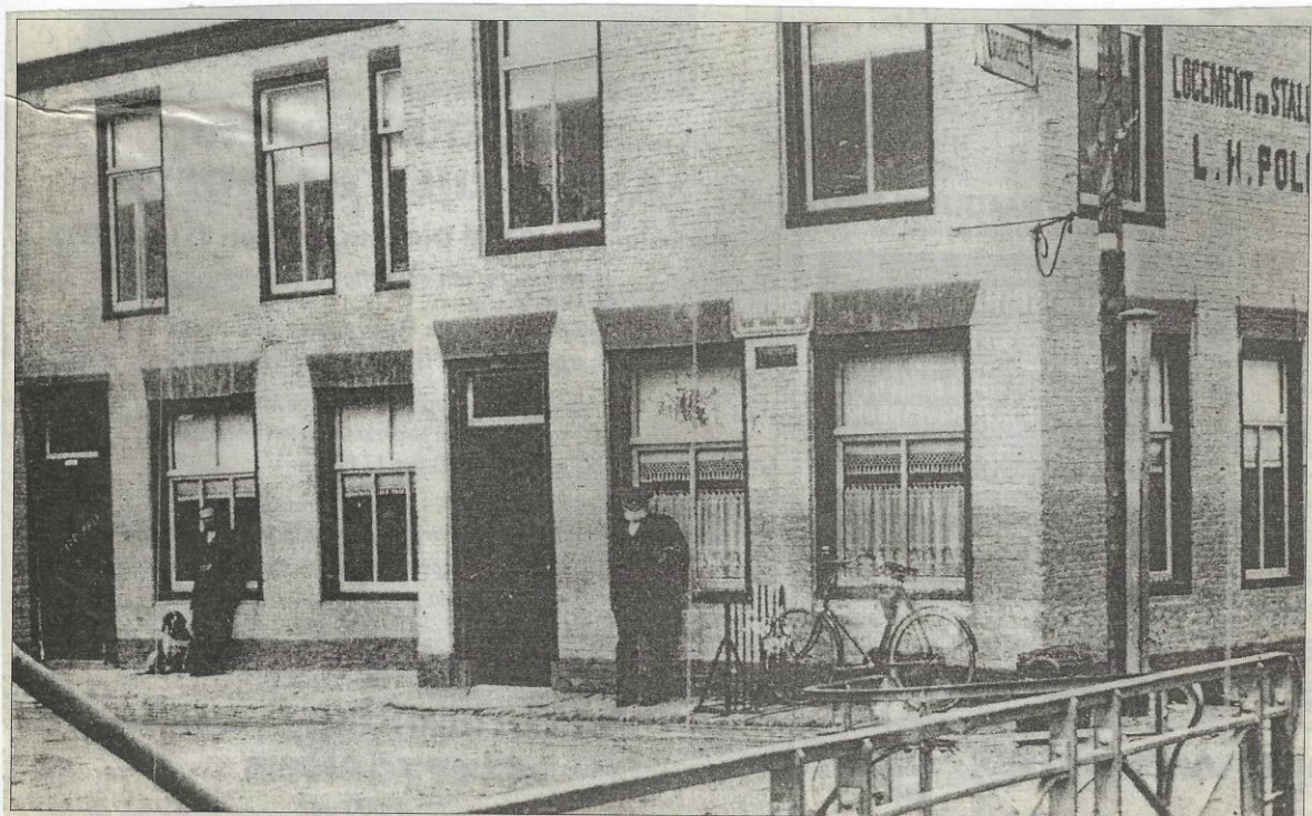
Dorpscafé te Gerkesklooster-Stroobos, in het begin van de 20ste eeuw, destijds nog Logement en Stalling L.H. Poll. De man met pet en baard is Lubbert Poll, de man met hond is zoon Tjeerd.