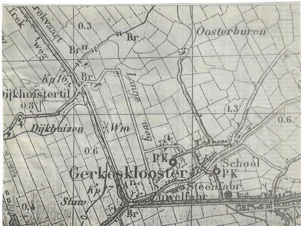
Topografische kaart (begin 20ste eeuw) van Gerkesklooster en omgeving.